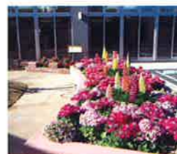
季節の移り変わりを五感で感じながら、ゆっくりと散策して下さい。