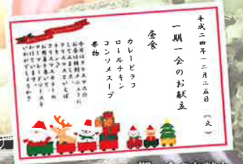
一期一会のお献立