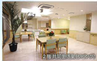
2階 共同生活室(リビング)