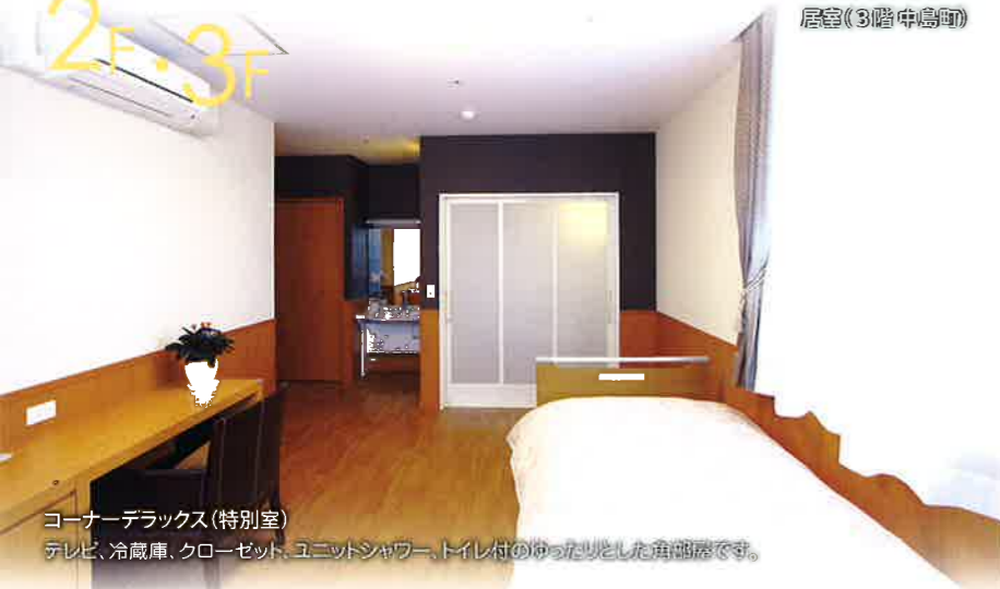
コーナーデラックス(特別室)

テレビ、冷蔵庫、クローゼット、ユニットシャワー、トイレ付のゆったりとした角部屋です。